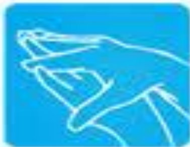
Dłoń do dłoni